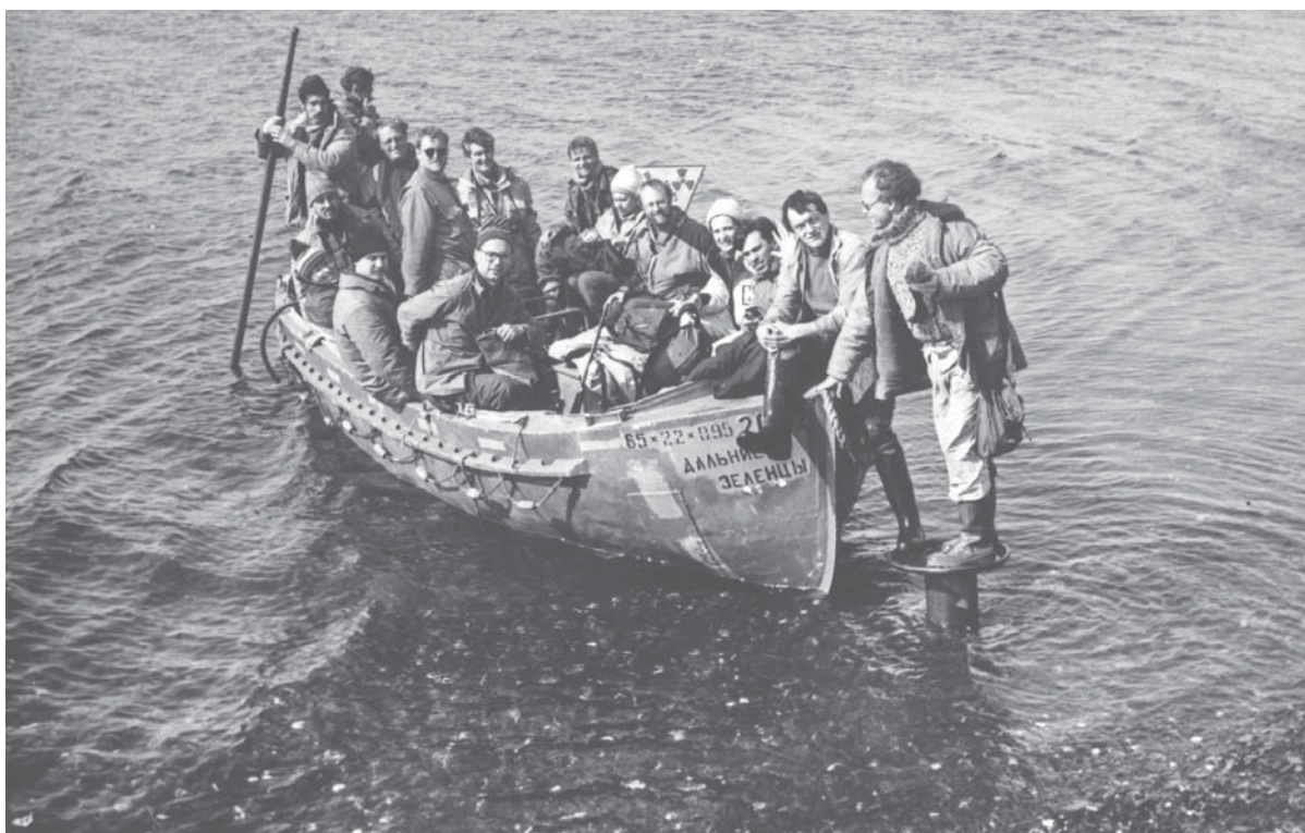
Рис. 1. Высадка российско-норвежской экспедиции (ученые ММБИ и «Акваплан-нива») в губе Черной (Новая Земля). 1992 г.

Сегодня уже очевидно, что Баренц-регион пережил бурный старт. Самое главное — человеческие контакты между народами стали обычными, рутинными. Проекты, осуществляемые в рамках сотрудничества, способствовали превращению Баренц-региона из чисто географического понятия в целостную структуру, связанную экономическими, культурными, политическими, социальными факторами.