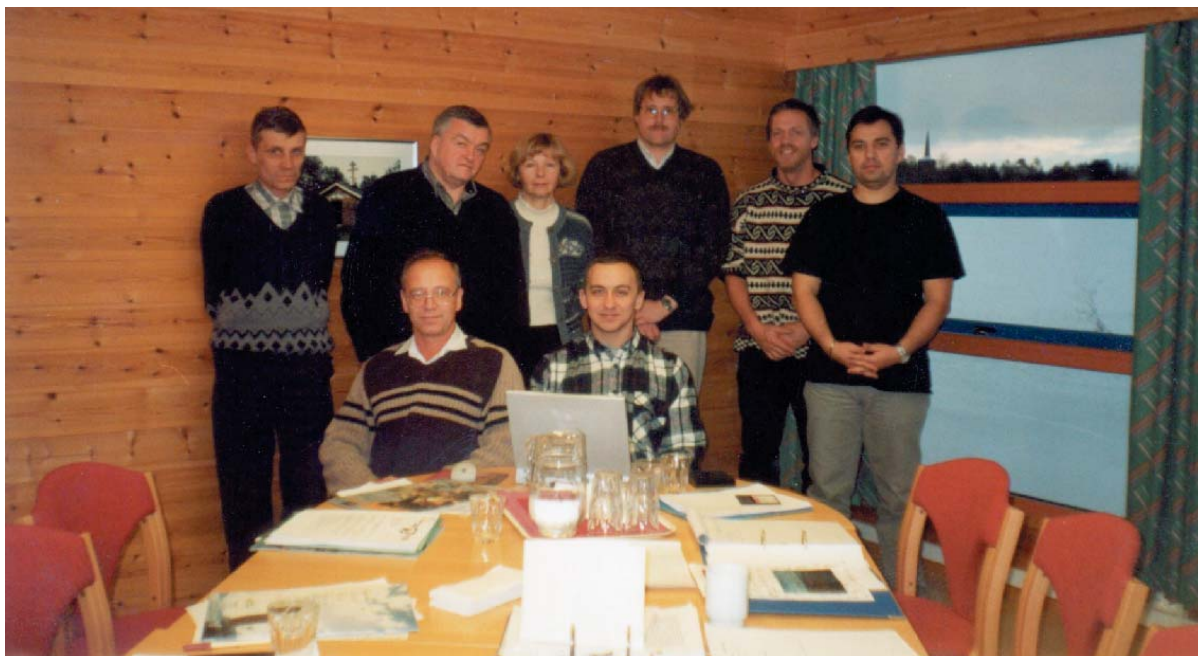
Рис. 2. Обсуждение российско-норвежского проекта приграничного сотрудничества «Kola-Varanger». Экологический центр Сваховда. Ноябрь 2001 г.

получила от Норвежского нефтяного директората контракты на сейсмологическую разведку в своем секторе Баренцева моря на сумму 22 млн евро, т. е. ей фактически обеспечена реальная работа на годы вперед.