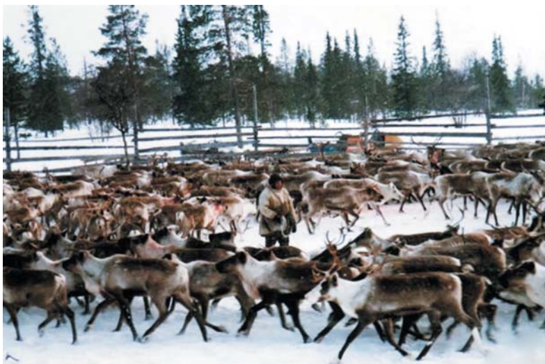
Рис. 2. Оленеводство — основа традиционного хозяйства и жизненного уклада саами.

Следует отметить высокий уровень общественной активности российских саами. В настоящее время на Кольском полуострове зарегистрировано восемь общественных организаций и три некоммерческих объединения, которые созданы для защиты прав и законных интересов коренных малочисленных народов Севера. Эти организации проводят мероприятия по защите мест проживания и хозяйственной деятельности коренных народов. При их