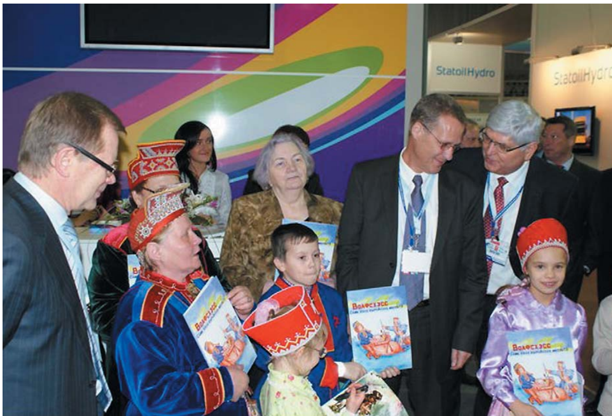
Рис. 3. Презентация саамского разговорника, предназначенного для изучения саамского языка детьми дошкольного и младшего школьного возраста. Совместный проект компании «Штокман Девелопмент» и областной общественной организации «Ассоциация кольских саамов».