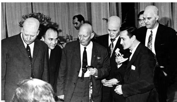
На юбилее академика А.П. Александрова