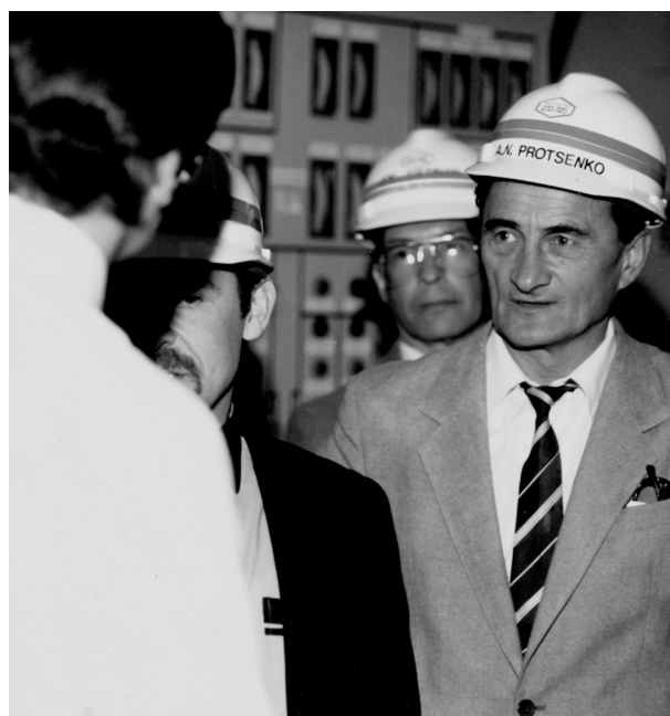
Визит на атомную станцию в Балтиморе (США)