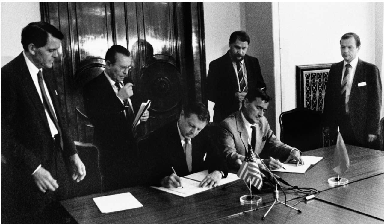
Подписание соглашений с США (1988 г.)