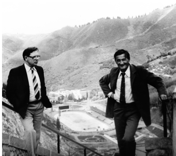
Проведение школы молодых ученых, Медео (слева — академик В.А. Легасов), начало 1980-х годов