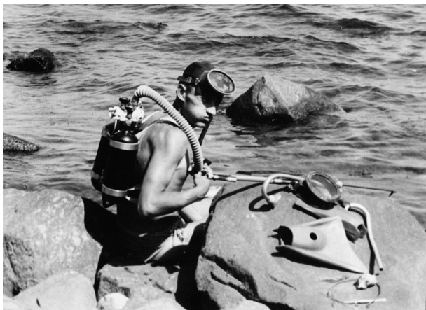
Погружение в Черное море (середина 1950-х годов)