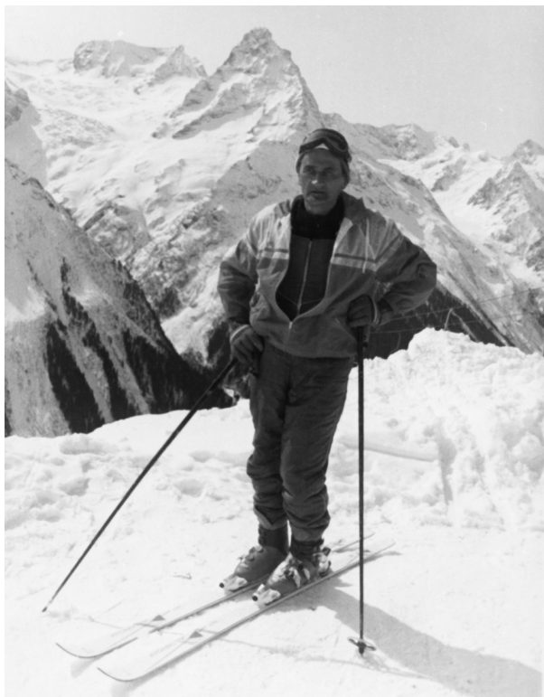
Отдых в горах, Домбай, 1992 г.

жах, что вообще объединяло в те годы «физиков и лириков».