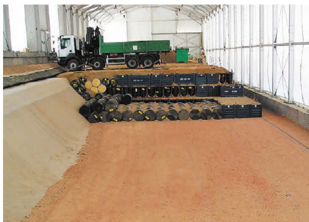
Рис. 2. Общий вид одной из траншей хранилища ОНАО в El Cabril [15]

Политика в отношении обращения с ОНАО не обязательно предполагает их захоронение в качестве РАО. Например, в Австрии и Китае для отходов, классифицируемых в соответствии с GSG-1 как ОНАО, это выдержка для распада и