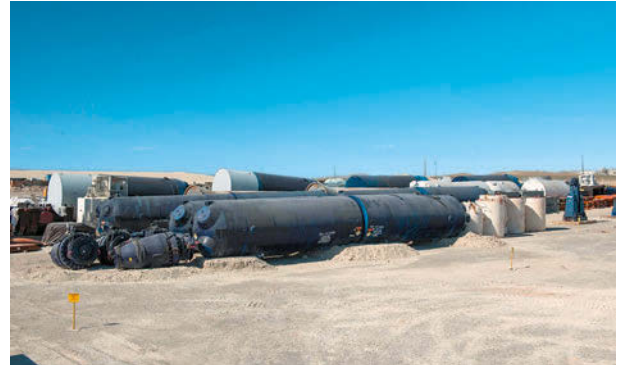
Рис. 4. Захоронение крупногабаритных отходов на площадке Clive в шт. Юта (США) [19]

Основной источник поступления отходов класса А — вывод из эксплуатации. Например, при выводе из эксплуатации АЭС Main Yankee с реактором PWR мощностью 860 МВт образовано 107 тыс. м 3 РАО, из которых 91 тыс. м 3 — отходы класса А [17]. На рис. 3 показано транспортирование РАО с площадки Main Yankee, а на рис. 4 — захоронение крупногабаритных отходов на площадке Clive. Отметим, что в США разрешено транспортирование и захоронение крупногабаритных отходов единым компонентом без разделки. Так, корпус реактора АЭС Main Yankee был транспортирован на барже для захоронения на площадке Barnwell. Кроме того, правила регулирования разрешают «усреднение концентраций» при определении класса отходов, т. е. уравнивание удельной активности в расчете на вес или объем, что дает возможность относить часть оборудования к классу А. Помимо расчетного усреднения допускается и физическое смешивание определенных отходов, называемое «блендированием»: отходы классов В и С могут смешиваться с отходами класса А для получения в итоге смеси отходов, удовлетворяющей критериям приемлемости коммерческого пункта захоронения для класса А [18].