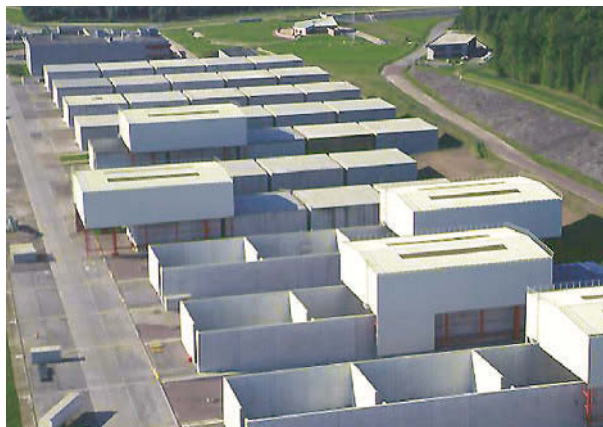
Рис. 3. Наземный ПЗРО для КНАО и КСАО во Франции [1]

Современная концепция наземного захоронения КНАО и КСАО одной из первых была реализована во Франции на объекте CSA, спроектированном на базе опыта эксплуатации сооружения захоронения CSM, действующего в период с 1969 по 1994 год. Конструкция сооружения захоронения CSA (рис. 3) представляет собой железобетонный модуль 25 м шириной и 8 м высотой, поделенный на отсеки. В отсеки мостовым или козловым краном под временным передвижным каркасным сооружением устанавливаются в штабель упаковки с РАО. По мере заполнения отсеков пространство между упаковками заполняется песчано-бентонитовой смесью. Заполненный отсек хранения сверху бетонируется, образуя железобетонный куб. Модули захоронения после заполнения и бетонирования всех