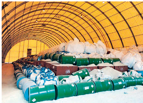
Рис. 2. Технология захоронения ОНАО объекта Cires на площадке Morvilliers (Франция) [3]

упрощенные конструкции ПЗРО в виде траншей и курганов (рис. 1, 2). Безопасность данных сооружений обеспечивается главным образом многослойными покрывающими и подстилающими экранами.