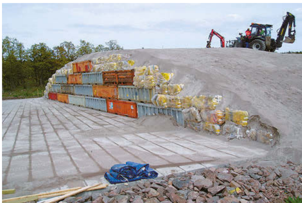
Рис. 1. Технология захоронения ОНАО на площадке АЭС Oskarhamn (Швеция) в процессе возведения покрывающего экрана [2]