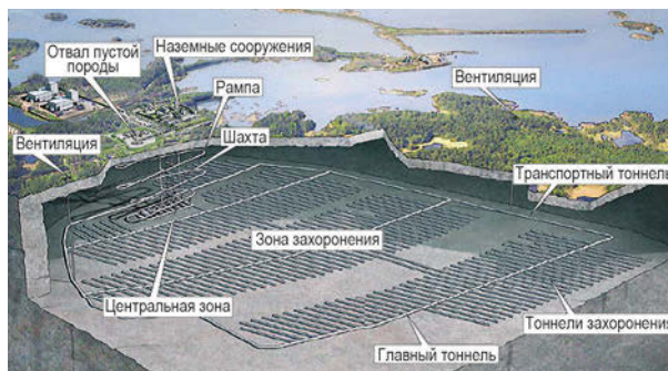
Рис. 7. Модель сооружения захоронения в соответствии с концепцией KBS-3 [24]

В Швеции с 1970-х годов ведется разработка глубинного пункта захоронения ОЯТ и ВАО в соответствии с концепцией под названием KBS-3. Площадка пункта окончательной изоляции ОЯТ размещается в регионе АЭС Forsmark в гранитном массиве на глубине около 500 м (рис. 7).