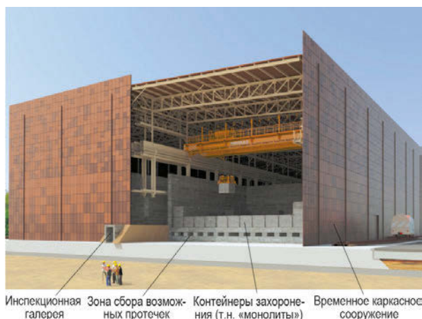
Рис. 4. Проект наземного ПЗРО для КНАО и КСАО в Бельгии [13]

отсеков покрываются многослойным покрытием, формирующим курган [7].