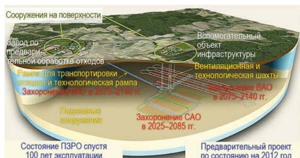
Рис. 8. Модель пункта окончательной изоляции РАО по проекту Cigeo [26]

планируется запустить в эксплуатацию ПЗРО, которое размещено на границе регионов Meuse и Haute de Marne, в северо-восточной части на глубине ~500 м в аргиллитовых формациях (рис. 8).