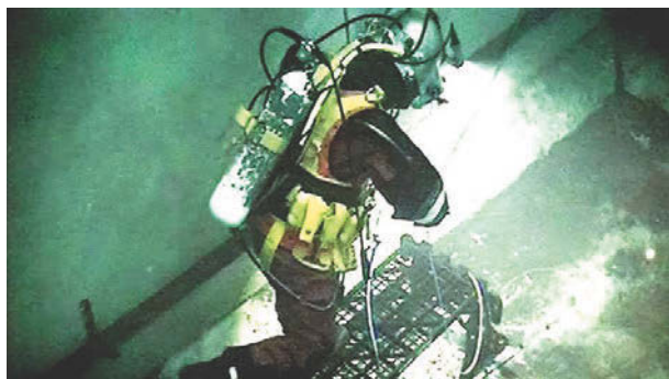
Рис. 1. Подводный демонтаж с привлечением дайверов в бассейне-хранилище ОЯТ на площадке АЭС Сайзвелл А

контейнеров с РАО и других загрязненных элементов на поверхность, где их разделявали на части и дезактивировали. Этот процесс был достаточно трудоемким, долгим, сопровождающимся риском радиоактивного облучения персонала. Применение инновационных технологий подводного демонтажа позволило снизить уровень облучения работников приблизительно в 20 раз по сравнению с использованием традиционных методик. Кроме того, такой способ демонтажа оказывает меньшее воздействие на окружающую среду, более эффективен, требует меньших затрат как временных, так и финансовых.