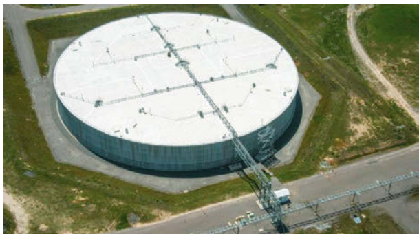
Рис. 3. Вид сверху на установку SDU S (Саванна Ривер)

растворов на площадке ядерного комплекса Саванна Ривер, где с 1950-х годов велось производство основных материалов, предназначенных для изготовления ядерного оружия (в основном трития и плутония-239). Конструкция бетонных резервуаров цилиндрической формы повторяет проекты установок для промышленного хранения воды и других жидкостей. Новая секция SDU 6 (114 м в диаметре и высотой 13 м), строительство которой было завершено в прошлом году, стала первой установкой подобного рода сверхбольшой вместимости — она в 10 раз вместительнее остальных. Всего для решения поставленных задач в области окончательного захоронения подобного рода РАО, в Саванна Ривер потребуются ввести в строй 7 таких резервуаров.