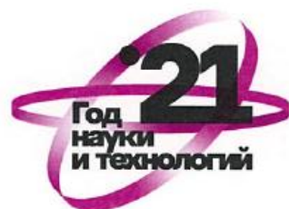
Вариант 4 Возможные темы для применения: химия, новые материалы