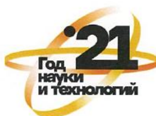
Вариант 5 Возможные темы для применения: связность территорий, история

Возможные темы для применения не обязательны, цветную версию логотипа можно выбрать на свое усмотрение