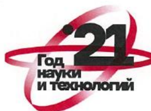
Вариант 2 Возможные темы для применения: генетика