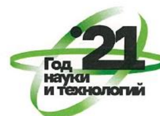
Вариант 3 Возможные темы для применения: биология, медицина, климат и экология