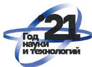
Вариант 1 Базовый логотип

Исходя из тематики мероприятия допускается использование цветной версии логотипа, отличной от базового